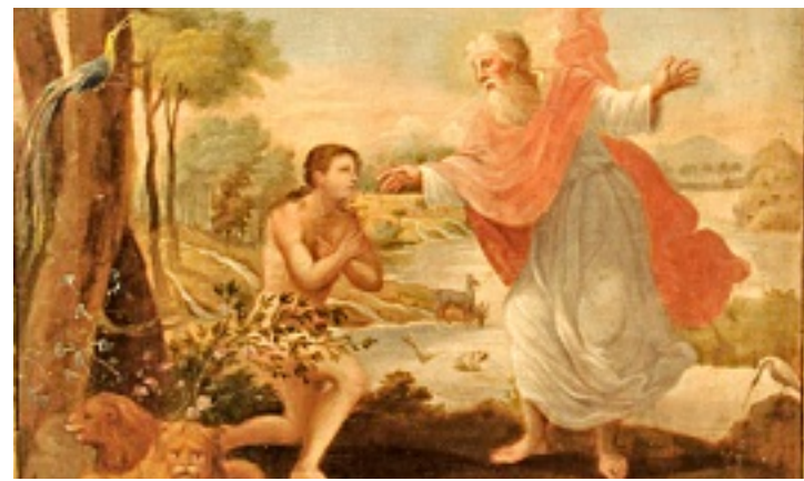
> Detalle de una de las obras de arte virreinal presentes en la muestra que abrirá el próximo miércoles el Museo de Historia Mexicana.

De forma previa a la inauguración, a las 19:00 horas, los cura-